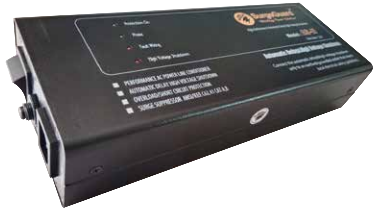
Model : AS-II (Version 2.0)

“ The majority of electronic equipment can be attributed to harmful surge, lightning, high voltage and noise most are so small and fast that go unnoticed, causing cumulative damage. Overtime, They can disable or destroy electronic circuits, requiring expensive repair or replacement.”