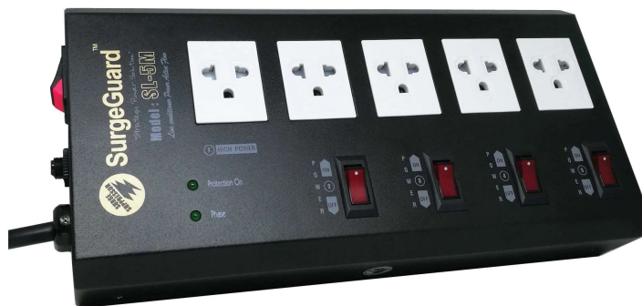
Model : SL-5M